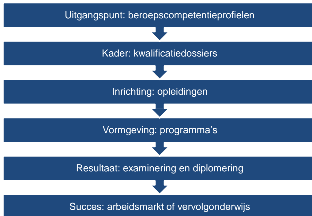
Figuur 1: Keten ontwikkeling middelbaar beroepsonderwijs

Bij een vierjarige opleiding in het mbo op niveau 4 duurt het nu maar liefst zeven jaar voordat deze keten tenminste eenmaal volledig is doorlopen en studenten een diploma verwerven. De onderdelen zijn namelijk strikt volgtijdelijk ingericht. De beroepscompetentieprofielen zijn vaak specifiek, sectoraal en smal geformuleerd. De kwalificatiedossiers bevatten vaak uitgebreide, scherp geformuleerde eisen. De ruimte voor inrichting en vormgeving is beperkt. Nadere doordenking is nodig van deze keten als geheel en van zaken als de opleidingsniveaus, de opleidingen zelf, de kennis en vaardigheden en de verschillen daarbij tussen/voor verschillende doelgroepen.